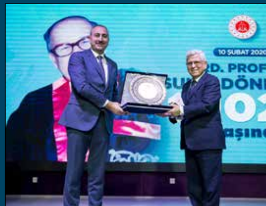
Bakan Gül, Ceza İnfaz Kurumu ve Tutukuevleri Personeli Ord. Prof. Dr. Sulhi Dönmezer İstanbul Eğitim Merkezinde düzenlenen panele katılan panelistlere plaket verdi.