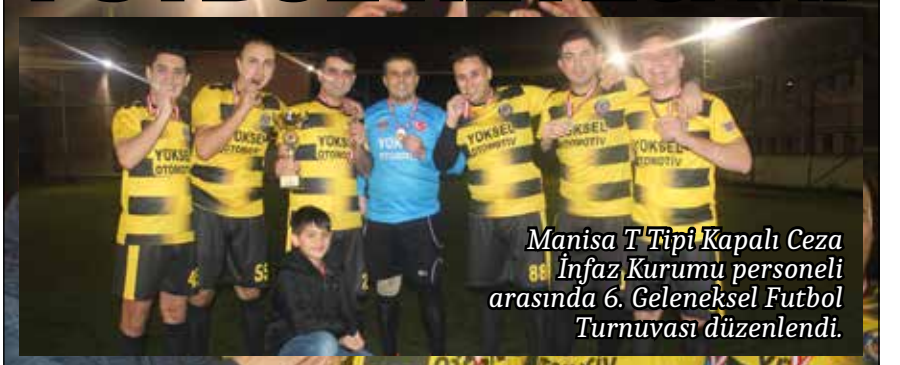
Manisa T Tipi Kapalı Ceza İnfaz Kurumu personeli arasında 6. Geleneksel Futbol Turnuvası düzenlendi.